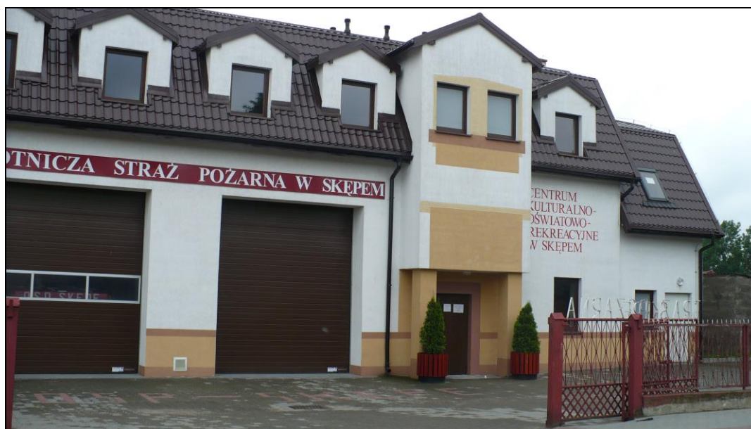
Fot. 3. Budynek Ochotniczej Straży Pożarnej oraz Centrum Kulturalno – Oświatowo – Rekreacyjnego