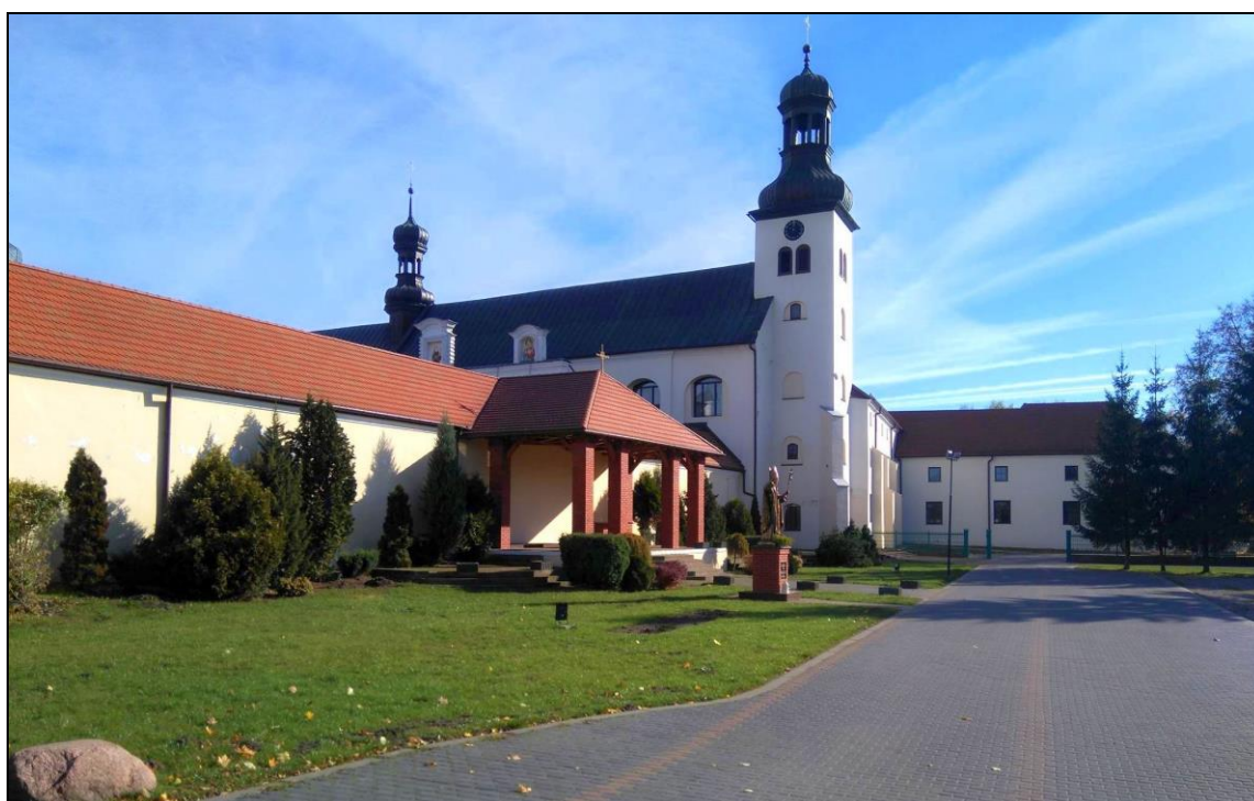
Fot. 6. Kościół i Klasztor Ojców Bernardynów