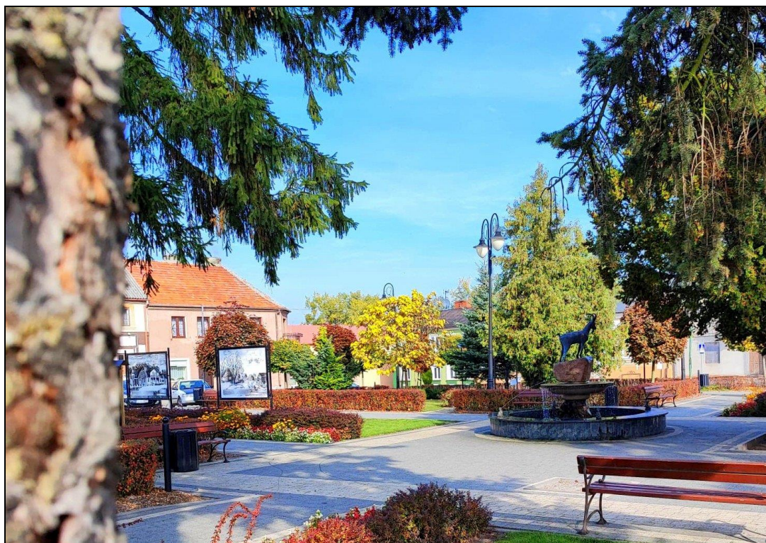
Fot. 5. Skępski skwerek