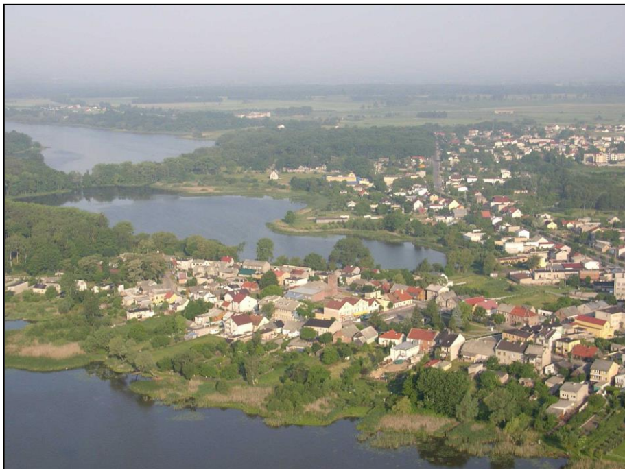
Fot. 1. Skępe – widok z lotu ptaka