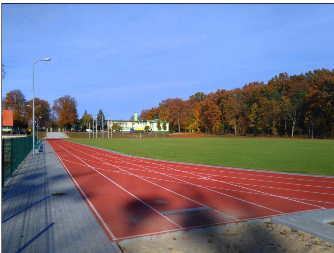
Fot. 4. Boisko Sportowe przy Zespole Szkół im. Waleriana Łukasińskiego