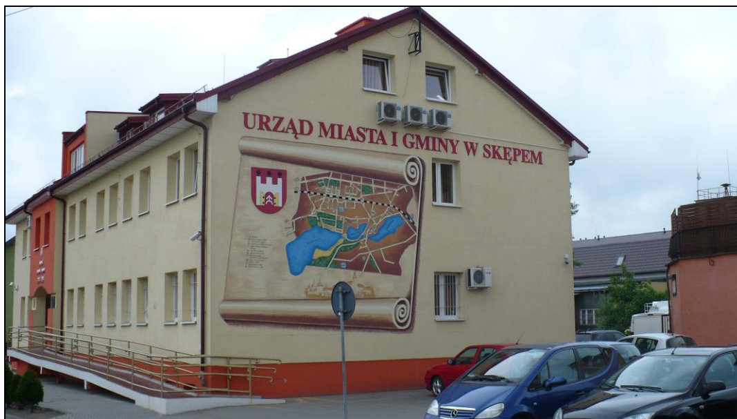
Fot. 2. Budynek Urzędu Miasta i Gminy